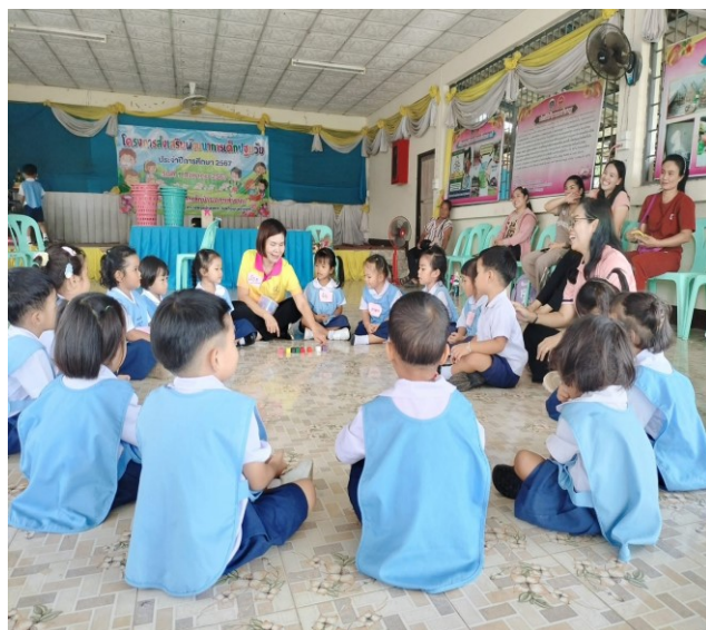
รูปภาพประกอบกิจกรรมการเรียนการสอนตามแผนปฏิบัติการประจำปีงบประมาณ พ.ศ.2568 ตามยุทธศาสตร์ 1-7 ศูนย์พัฒนาเด็กเล็กบ้านโนนเจริญ ตำบลกุดชุมภู อำเภอฟินมั่งสังหาร จังหวัดอุบลราชธานี